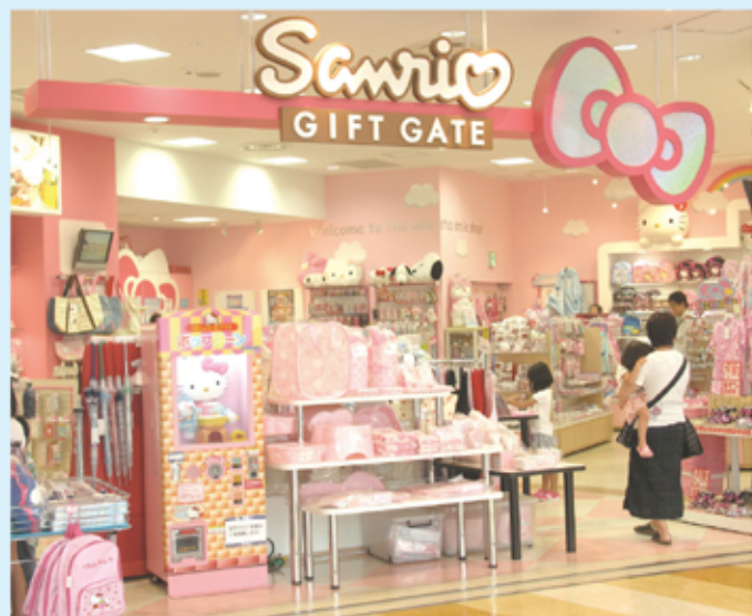
錦糸町ギフトゲート (東京都)