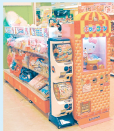
「ポンポンパック2」と「カプセルベンダー」の組み合わせ設置例

袋のデザインならびに取扱い温度などは予告無しに変更することがあります。ご了承ください。