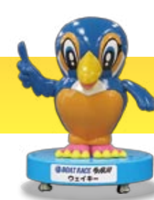
BOAT RACE 多摩川 ウェイキー