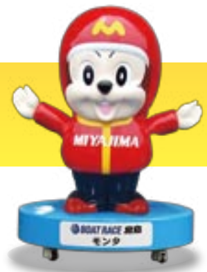
BOAT RACE 宮島 モンタ