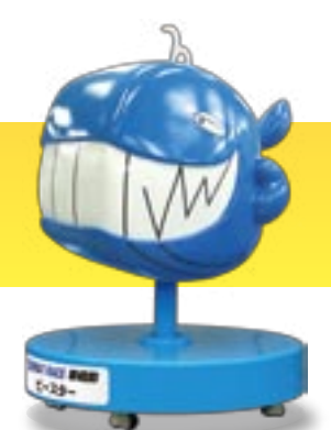
BOAT RACE 平和島 ピースター