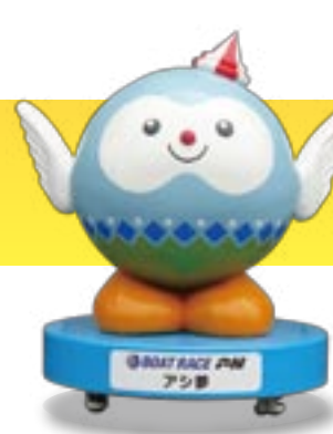
BOAT RACE 芦屋 アシ夢