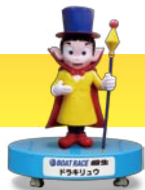
BOAT RACE 桐生 ドラキリュウ