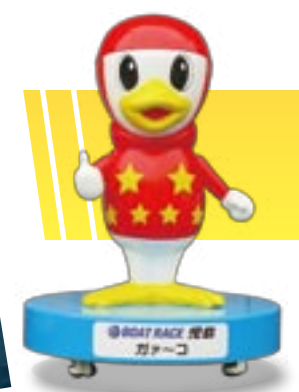
BOAT RACE 児島 ガア〜コ