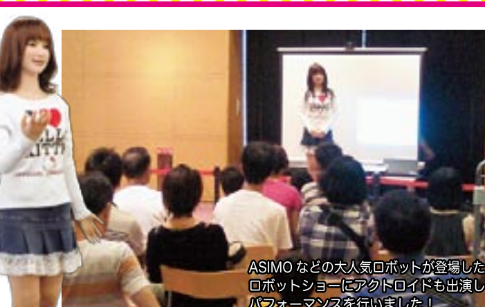
ASIMOなどの大人気ロボットが登場したロボットショーにアクトロイドも出演しパフォーマンスを行いました!