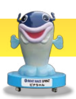
BOAT RACE びわこ ビナちゃん