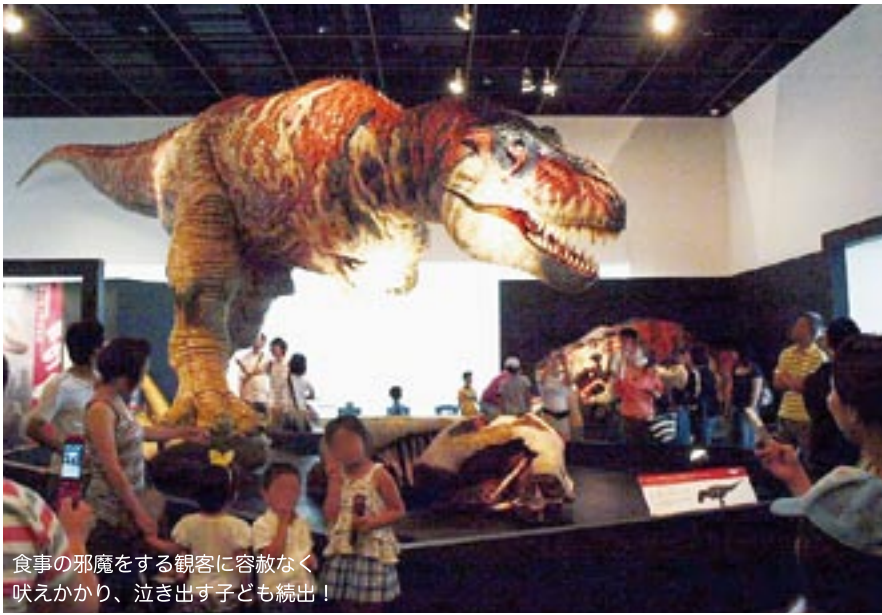
食事の邪魔をする観客に容赦なく吠えかかり、泣き出す子ども続出！

そして新作の恐竜動刻はどれも見応え満点。実物大の迫力に加え新説のテーマである新たな解釈で復元された姿、食性や鳴き声の変化、表皮の質感や色変化までも表現した“変化する恐竜”たちは世界初の最先端機能を搭載することで実現しました。この企画展は日本からアジア、そして米国へと巡回を予定しています。