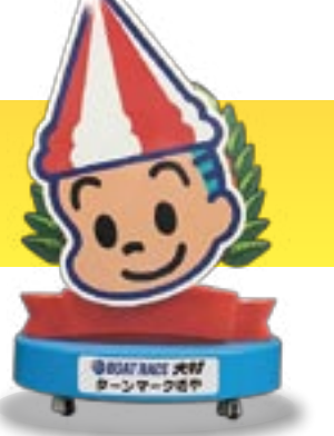
BOAT RACE 大村 ターンマーク坊や