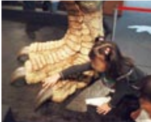
ドキドキ! ティラノサウルスの左足に触ることができる。