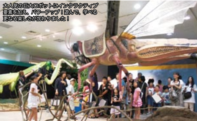
大人気の巨大ロボットにインタラクティブ要素を加え、パワーアップ!遊んで、学べる、更なる楽しさが加わりました!

などを交え、エンターテインメント性に学習効果をプラスした、盛り沢山の内容になっています。この新パッケージは、大英自然史博物館の運営によって、今後もヨーロッパ各地を巡回していく予定です。