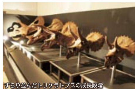
ずらり並んだトリケラトプスの成長段階