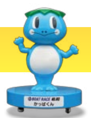
BOAT RACE 若松 かっぱくん