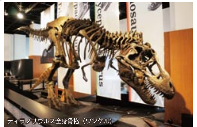
ティラノサウルス全身骨格（ワンケル）