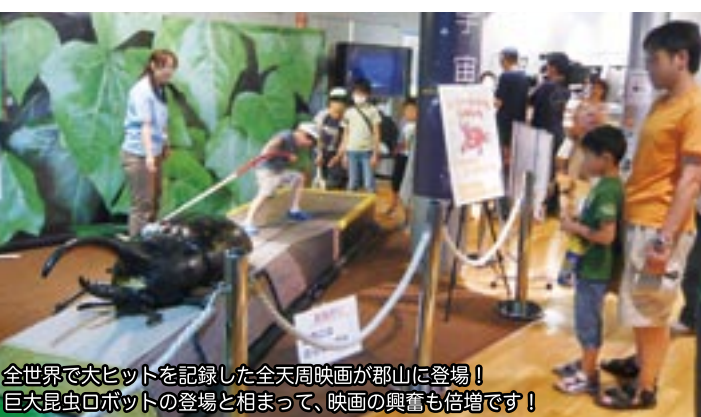
全世界で大ヒットを記録した全米映画が郡山に登場! 巨大昆虫ロボットの登場と相まって、映画の興奮も倍増です!