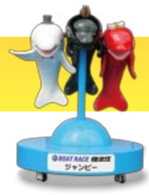
BOAT RACE 住之江 ジャンピー