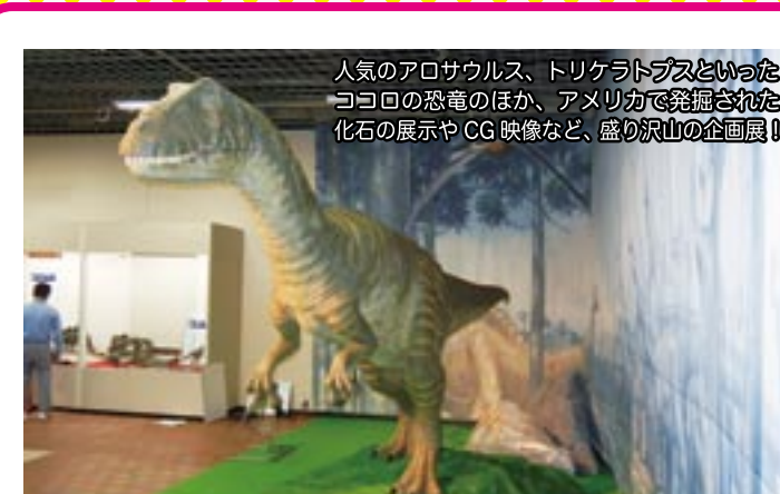
人気のアロサウルス、トリケラトプスといったココロの恐竜のほか、アメリカで発掘された化石の展示やCG映像など、盛り沢山の企画展!