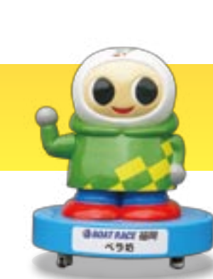
BOAT RACE 福岡 ペラ坊