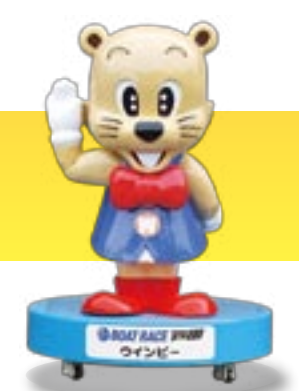
BOAT RACE 戸田 ウインビー