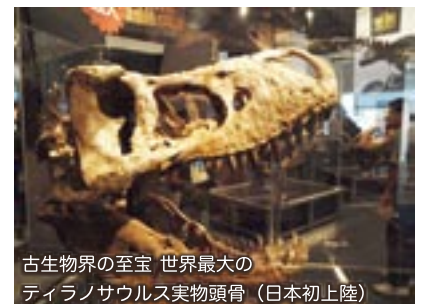
古生物界の至宝 世界最大の ティラノサウルス実物頭骨（日本初上陸）