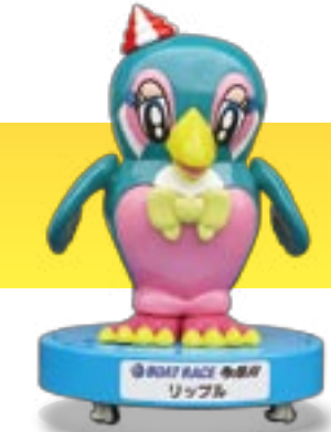
BOAT RACE 多摩川 リップル