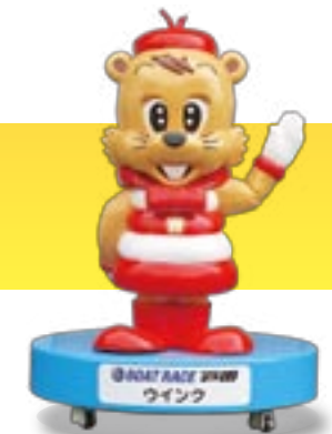
BOAT RACE 戸田 ウインク