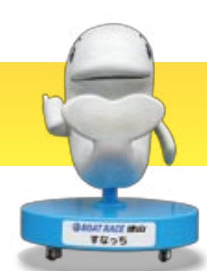
BOAT RACE 徳山 すなっち