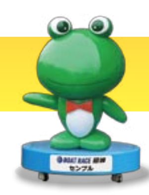
BOAT RACE 尼崎 センプル