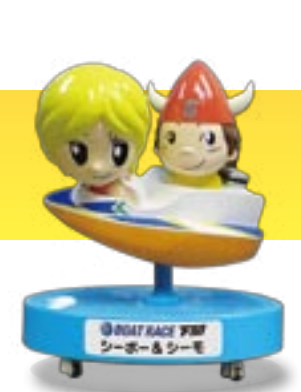
BOAT RACE 下関 シーボー&シーモ