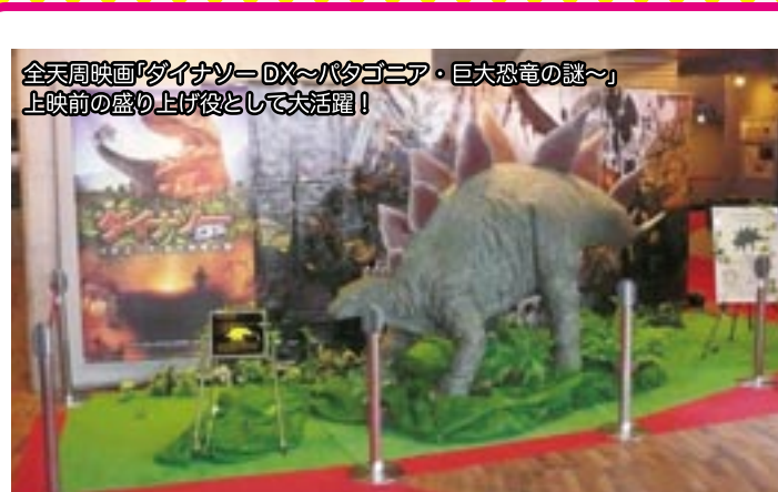
全米映画「ダイナソーDX〜パタゴニア・巨大恐竜の謎〜」上映前の盛り上げ役として大活躍!