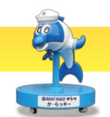
BOAT RACE かつ か・らっきー