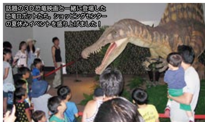
話題の3D恐竜映画と一緒に登場した恐竜ロボットたち。ショッピングセンターの夏休みイベントを盛り上げました!