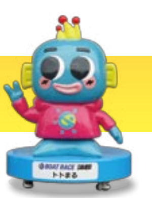
BOAT RACE 蒲郡 トトまる