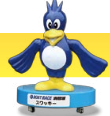
BOAT RACE 浜沼湖 スワッキー