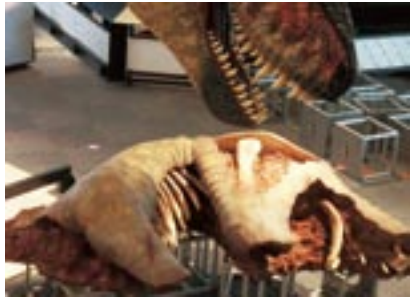
ごちそうであるトリケラトプスの死骸。これも“ある”化石標本の復元展示。