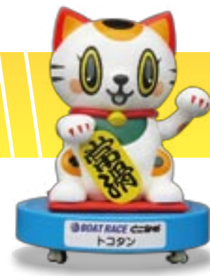
BOAT RACE 七尾 トコタン