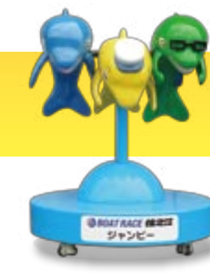
BOAT RACE 住之江 ジャンピー