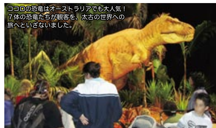
ココロの恐竜はオーストラリアでも大人気! 7体の恐竜たちが観客を、太古の世界への旅へとご案内しました。