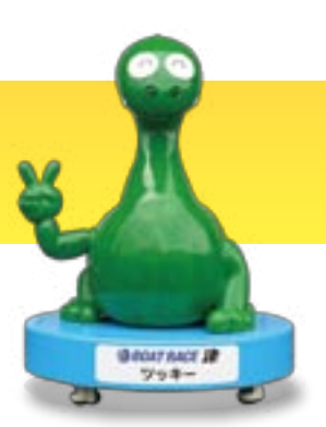
BOAT RACE 津 ツッキー