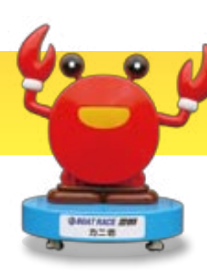
BOAT RACE 三田 カニ坊