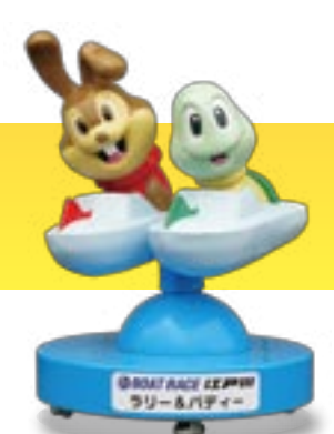
BOAT RACE 江戸川 ラリー&パディー