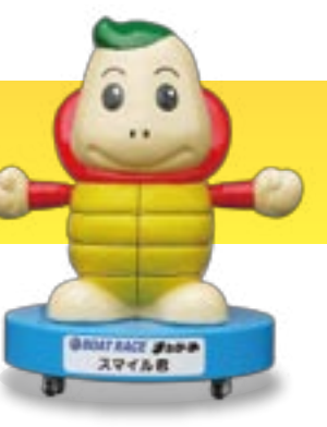
BOAT RACE まがめ スマイル君