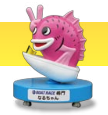
BOAT RACE 鳴門 なるちゃん