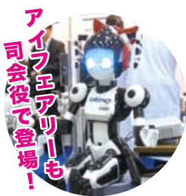
アイフェアリーも司会役で登場！

2年おきに開催されている本展示会。出展し「歯科臨床実習用ヒト型患者ロボットシミュレータ SIMROID®」を展示しました。弊社では日本歯科大学附属病院、株式会社モリタ、株式会社モリタ製作所と共同