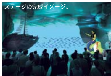
ステージの完成イメージ。