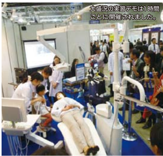
大盛況の実習デモは1時間ごとに開催されました。