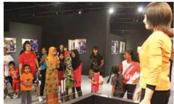
あのアクトロイドのテクノロジーを学べると世界中で大好評！2012年は日本国内での初開催も決定しました！

National Science Centre, Kuala Lumpur (マレーシア)