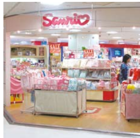
リヴィン光が丘 3F サンリオコーナー (東京都) でロケーションテストを行いました。