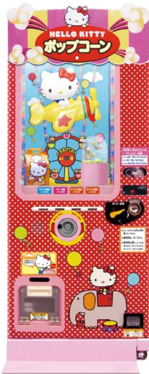
※デザインは開発中のものです。実際の製品とは異なる場合があります。ご了承ください。