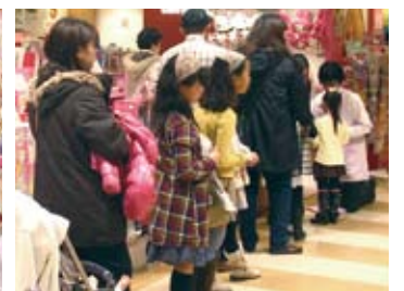
大好評のカード交換会には長蛇の列!