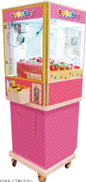
※デザインは開発中のものです。実際の製品とは異なる場合があります。ご了承ください。

キャラッチーノは、お子様やクレーンゲームが苦手な方でも楽しんでいただけるように開発されました。従来のクレーンゲームに比べ、とても景品を取りやすく、そのお手軽さとカワイイ景品が人気を呼び、設置店舗を拡大中です!