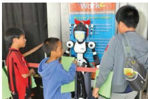
「AEDI」という名前をもらったI-FAIRY。展示ホール入口に設置され、お客様をお迎えしています。