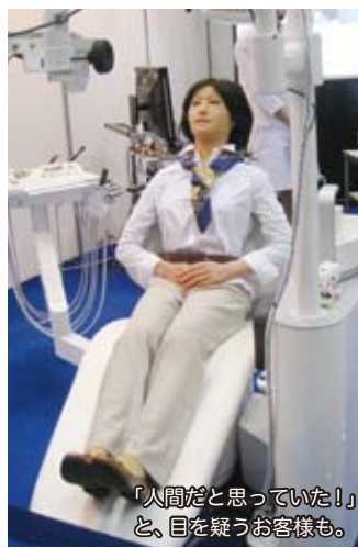
「人間だと思っていた！」と、目を疑うお客様も。

会場では SIMROID® を用いたデモを行い、連日多くの方が詰めかけました。外見のリアルさだけでなく、先進的な医療実習システムとしても注目を集めました。今後 SIMROID® の完成は2012年春以降を予定しています。取材や販売については2012年春以降に株式会社モリタ様へ、お問い合わせ下さい。