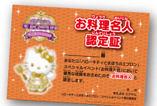
高得点の方にはオリジナルの「お料理名人認定証」をプレゼント!

毎回多くのお客様が参加するこのイベント。お店の方からも「店頭が活性化し、店舗全体の売上アップにもつながる」と好評です。初めてのゲームでも使える「スターカードセット」を配付することで、新規ファンの開拓をし「まほエプ」人口を拡大中です!